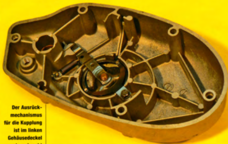
Der Ausrückmechanismus für die Kupplung ist im linken Gehäusedeckel untergebracht