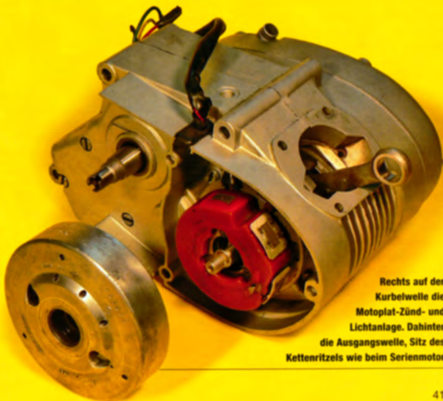
Rechts auf der Kurbelwelle die Motoplat-Zünd- und Lichtanlage. Dahinter die Ausgangswelle, Sitz des Kettenritzels wie beim Serienmotor