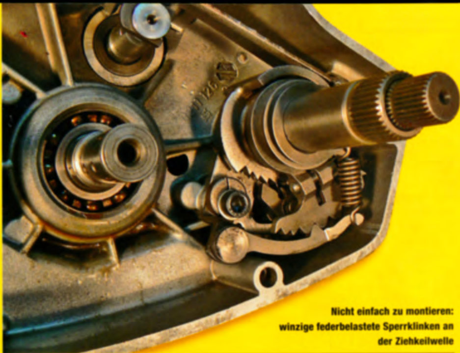
Nicht einfach zu montieren: winzige federbelastete Sperrklinken an der Ziehkeilwelle

Einmal richtig montiert und eingestellt, ist der Motor sehr zuverlässig, wobei sich Kritik nur an dem sensibel zu schaltenden Getriebe mit dem schnell verschleißenden Ziehkeil festmachen lässt, aber im Gegensatz zum Moto Cross-Einsatz kann man damit im Gelände ganz gut zurechtkommen. Wenn dies alles in Relation zum Gestehungspreis gesehen wird, ergibt sich ein eindrucksvolles Preis-Leistungsverhältnis, und da hatte Karlheinz Spieß zweifellos Recht. ▷