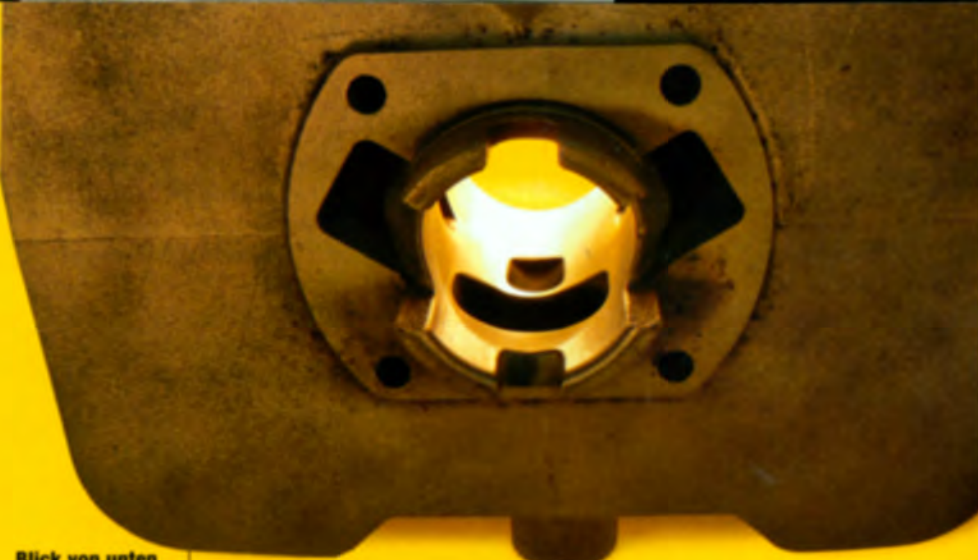
Blick von unten auf den Zylinder mit 40 Millimeter Bohrung, auf den Einlass-, die zwei seitlichen und den dritten Überströmkanal

Nur wurde im Falle dieser Ancillotti eine von der Werkseinstellung deutlich abweichende Vergasereinstellung erforderlich, da hier eine sehr voluminöse Ansaugbox mit einem widerstandsarmen Schaumstofffilterelement zum Einsatz kommt. Für das breite verwertbare Drehzahlband ist auch die serien-