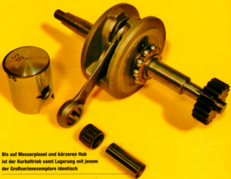
Bis auf Messerpleuel und kürzeren Hub ist der Kurbeltrieb samt Lagerung mit jenem der Großserienexemplare identisch