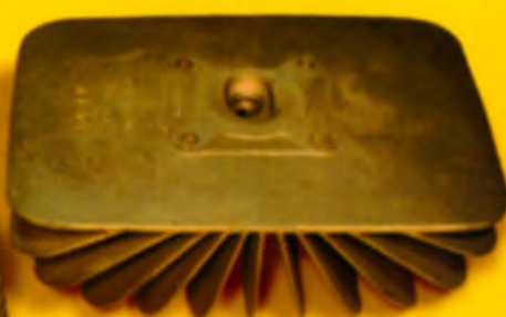
Rechts im Bild der Zylinderdeckel mit Quetschkante und ovalem Brennraum. Dank guter Kühlung reicht Zündkerzen-Wärmewert 260