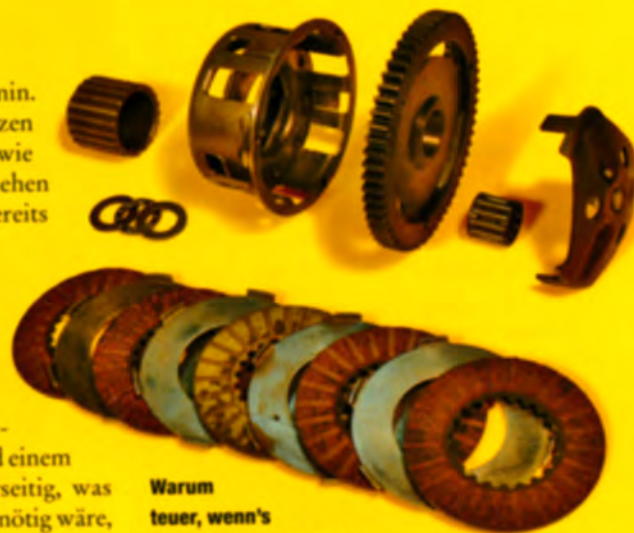
Warum teuer, wenn's auch günstig geht: Die Kupplungsdruckglocke (oben rechts) ist ein simples Pressblechteil

Serienmäßig blieb auch die Lagerung in zwar einstellempfindlichen, dafür seitenkraftresistenten Schrägkugellagern und einem zusätzlichen Wälzager primärseitig, was aber bei diesem Motor gar nicht nötig wäre, da die hier eingesetzte schmale Primärverzahnung (19:61 Zähne) als Geradverzahnung ausgeführt ist und die Welle somit völlig frei von Seitenkräften bleibt. Abgesehen von der Geradverzahnung und dem nadelgelagerten Kupplungskorb blieb auch die Kupplung in allen Teilen serienmäßig, sie kommt mit der Mehrleistung problemlos zurecht. Genauso problemlos verkraften die Getrieberäder diese Mehrleistung, obwohl sie gegenüber der 50S-Serie mit ihren fünf und sechs